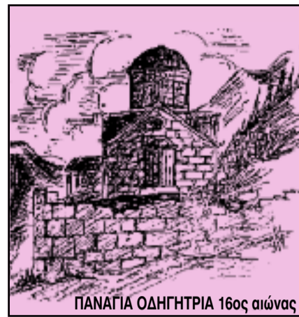
ΠΑΝΑΓΙΑ ΟΔΗΓΗΤΡΙΑ 16ος αιώνας

ΤΡΙΜΗΝΙΑΙΑ ΕΚΔΟΣΗ ΤΟΥ ΣΥΝΔΕΣΜΟΥ ΒΑΣΙΛΟΠΟΥΛΙΩΤΩΝ ΞΗΡΟΜΕΡΟΥ «Η ΒΕΛΑ» Ν. ΑΙΤΩΛ/ΝΙΑΣ ΓΡΑΦΕΙΑ: Ανδρομάχης 77 - ΚΑΛΛΙΘΕΑ • Τ. 210-9519057, 7516459, 2468608 - ΤΗΛ. - FAX: 210-7517882 - 22950-23277 • Τ.Κ. 176 75 ΚΑΛΛΙΘΕΑ • e-mail: info@4epoches.com Έτος 18ο • Αριθμός φύλλου 79 • ΑΠΡΙΛΙΟΣ - ΜΑΪΟΣ - ΙΟΥΝΙΟΣ 2014