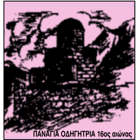
ΠΑΝΑΓΙΑ ΟΔΗΓΗΤΡΙΑ 16ος αιώνας

ΤΡΙΜΗΝΙΑΙΑ ΕΚΔΟΣΗ ΤΟΥ ΣΥΝΔΕΣΜΟΥ ΒΑΣΙΛΟΠΟΥΛΙΩΤΩΝ ΞΗΡΟΜΕΡΟΥ «Η ΒΕΛΛΑ» Ν. ΑΙΤΩΛ/ΝΙΑΣ ΓΡΑΦΕΙΑ: Ανδρομάχης 77 - ΚΑΛΛΙΘΕΑ • Τ 210-9519057, 7516459, 2468608 - ΤΗΛ. - FAX: 210-7517882 - 22950-23277 • Τ.Κ. 176 75 ΚΑΛΛΙΘΕΑ • e-mail: info@4epoches.com Έτος 18ο • Αριθμός φύλλου 78 • ΙΑΝΟΥΑΡΙΟΣ - ΦΕΒΡΟΥΑΡΙΟΣ - ΜΑΡΤΙΟΣ 2014