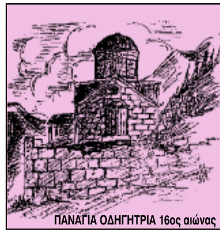
ΠΑΝΑΓΙΑ ΟΔΗΓΗΤΡΙΑ 16ος αιώνας

ΤΡΙΜΗΝΙΑΙΑ ΕΚΔΟΣΗ ΤΟΥ ΣΥΝΔΕΣΜΟΥ ΒΑΣΙΛΟΠΟΥΛΙΩΤΩΝ ΞΗΡΟΜΕΡΟΥ «Η ΒΕΛΛΑ» Ν. ΑΙΤΩΛ/ΝΙΑΣ