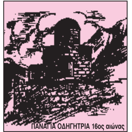
ΠΑΝΑΓΙΑ ΟΔΗΓΗΤΡΙΑ 16ος αιώνας

ΤΡΙΜΗΝΙΑΙΑ ΕΚΔΟΣΗ ΤΟΥ ΣΥΝΔΕΣΜΟΥ ΒΑΣΙΛΟΠΟΥΛΙΩΤΩΝ ΞΗΡΟΜΕΡΟΥ «Η ΒΕΛΑ» Ν. ΑΙΤΩΛ/ΝΙΑΣ ΓΡΑΦΕΙΑ: Ανδρομάχης 77 - ΚΑΛΛΙΘΕΑ • ☎ 210-9519057 - 210-9592773 - ΤΗΛ. - FAX: 22950-23277 - 210-9578787 • Τ.Κ. 176 75 ΚΑΛΛΙΘΕΑ Έτος 18ο • Αριθμός φύλλου 75 • ΑΠΡΙΛΙΟΣ - ΜΑΪΟΣ - ΙΟΥΝΙΟΣ 2013