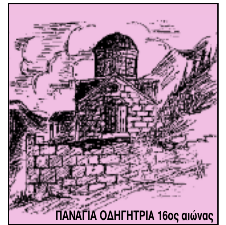
ΠΑΝΑΓΙΑ ΟΔΗΓΗΤΡΙΑ 16ος αιώνας

ΤΡΙΜΗΝΙΑΙΑ ΕΚΔΟΣΗ ΤΟΥ ΣΥΝΔΕΣΜΟΥ ΒΑΣΙΛΟΠΟΥΛΙΩΤΩΝ ΞΗΡΟΜΕΡΟΥ «Η ΒΕΛΛΑ» Ν. ΑΙΤΩΛ/ΝΙΑΣ